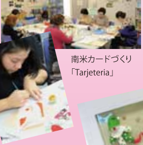
南米カードづくり「Tarjeteria」