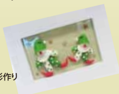
小麦粉粘土人形作り