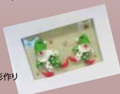
小麦粉粘土人形作り