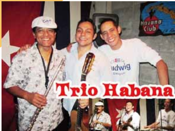
キューバの楽団 「El Trio Habana」