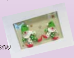
小麦粉粘土人形作り