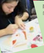
小麦粉粘土人形作り